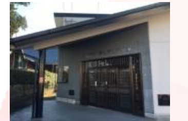
五郎丸老人憩いの家