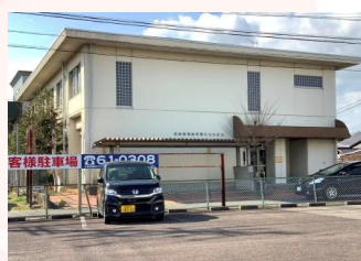
犬山南地区学習等供用施設