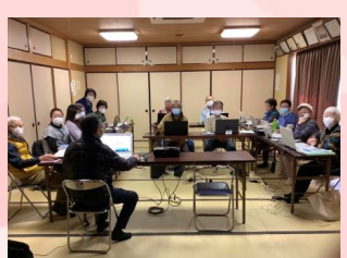
⑯ 高齢者パソコン教室