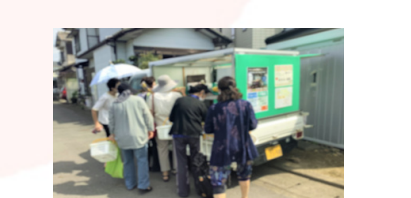
⑮ 買い物支援ネットワーク