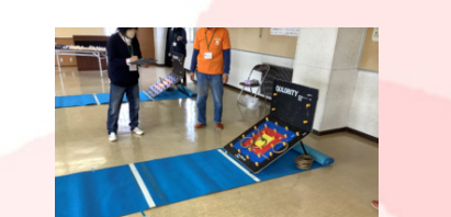
⑦ 東西専正寺いきいきサロン