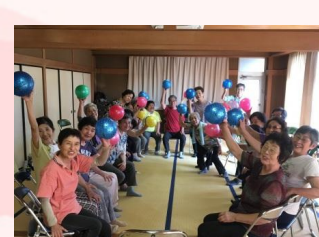
⑬ いきいき筋トレ会