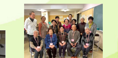
⑩ 年金者元気サロン