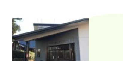
五郎丸老人憩いの家