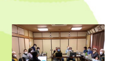
㉓ 高齢者パソコン教室