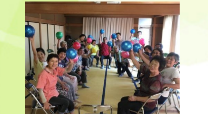
㉒ いきいき筋トレ会