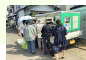
⑬ 買い物支援ネットワーク