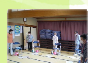
⑤ わかあゆ会 B