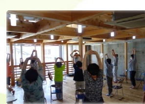
⑥ よさか生き生きサロン