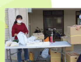
② 犬山どんでん朝市