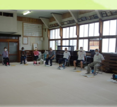
④ 丸山寄りあおう会