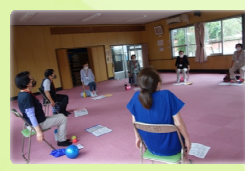
① 健康らくらく体操