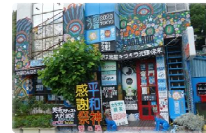
④ パブレスト 百万ドル